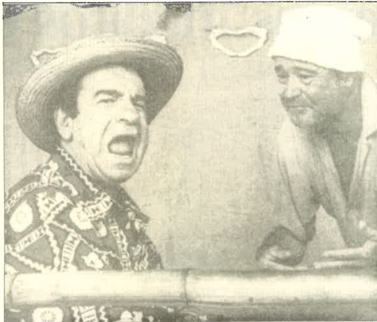
Walter Matthau, a la izquierda, y Jack Lemmon.

Walter y yo somos muy amigos. Nos vemos una o dos veces a la semana. Jack Lemmon nos acompaña