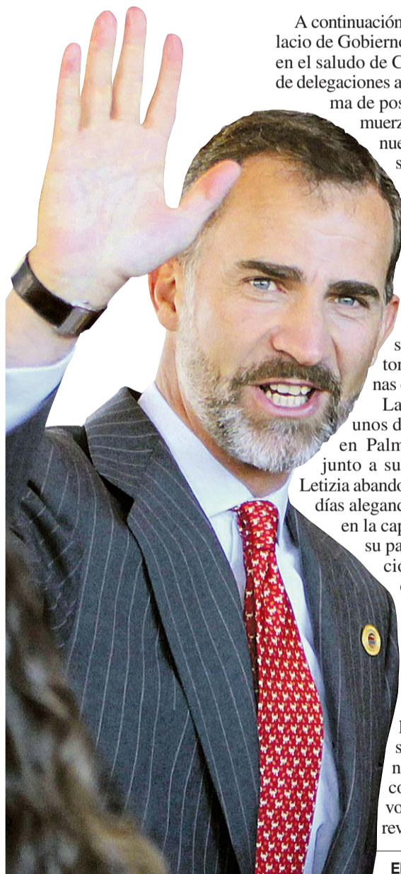
El Príncipe Felipe.

Tras recibir las llaves de la ciudad en el centro cultural El Cabilido, don Felipe asistirá en la catedral metropolitana al Te Deum que será oficiado con ocasión de la apertura del nuevo periodo constitucional y en conmemoración del 476 aniversario de la fundación de Asunción.