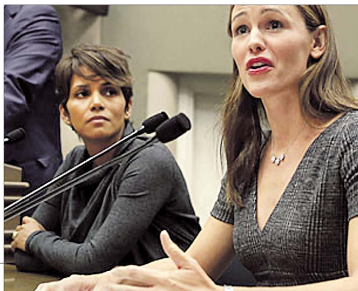
Berry y Garner, en su comparecencia.

Las actrices Jennifer Garner y Halle Berry están en guerra con los paparazzi, tras acudir a la Asamblea de California para declarar a favor de una ley que les impida fotografiar a hijos de famosos. «Somos madres que intentamos proteger a nuestros hijos», declaró Berry, embarazada. Se trata de un proyecto de ley propuesto por un senador demócrata, que busca penalizar a estos profesionales. Por su parte, los medios estadounidenses consideran la propuesta una restricción a la libertad de información.