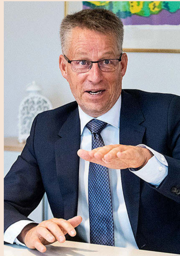
Teppo Tauriainen, embajador de Suecia en España.

– Los fondos llevan aparejados reformas. ¿Qué garan-