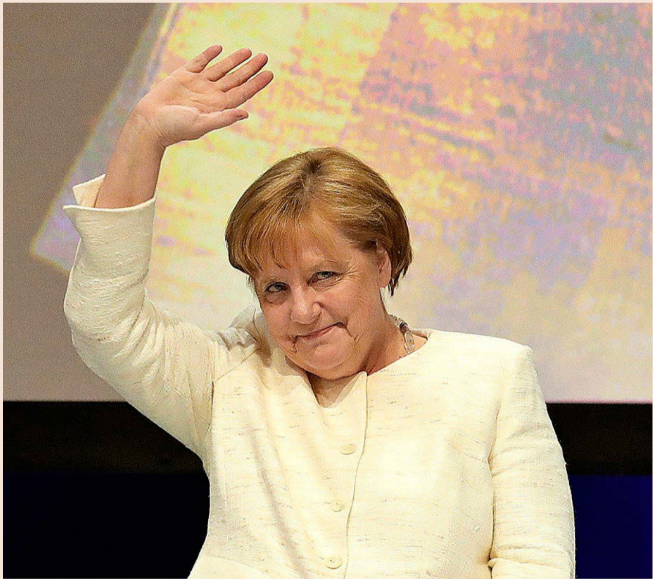
La canciller de Alemania, Ángela Merkel.

entrevistadores le preguntan entonces qué fuerzas centrífugas sacuden a la Unión Europea. Y responde: “Citaré dos. Una es que la distribución del bienestar ha cambiado en el mundo. Cuando me nombraron Canciller, nuestro PIB era mayor que el de China: Alemania 2,8 billones de dólares, China 2,3 billones. En los últimos dieciséis años, nosotros hemos llegado a 3,8 billones, y China a 14,7. Nosotros, alemanes, pero también nosotros, europeos, tendremos que trabajar muy duro para mantener nuestra proporción en el bienestar global. En mi opinión, el otro peligro es la tentación, falsa, de actuar de forma nacional. Algunos europeos se preguntan, en tiempos económicamente difíciles, si su país no debería pensar primero en sí mismo. La pregunta es comprensible [...]. Pero todos los países de la Unión Europea, de esto estoy absolutamente convencida, pueden alcanzar mayor bienestar mediante el mercado interior y la configuración in-